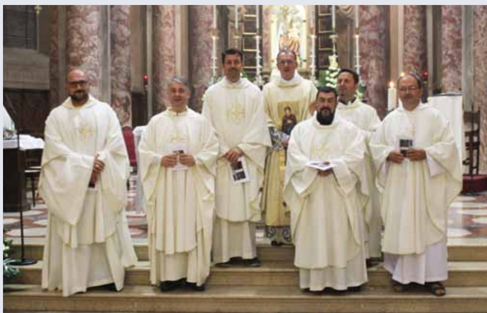
Anniversario di ordinazione sacerdoti 1996 7 giugno 2017, Chiesa di Santa Maria

E, per favore, non dimenticatevi di pregare per me. □