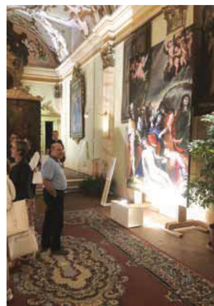
Mostra nella chiesa di San Pietro martire