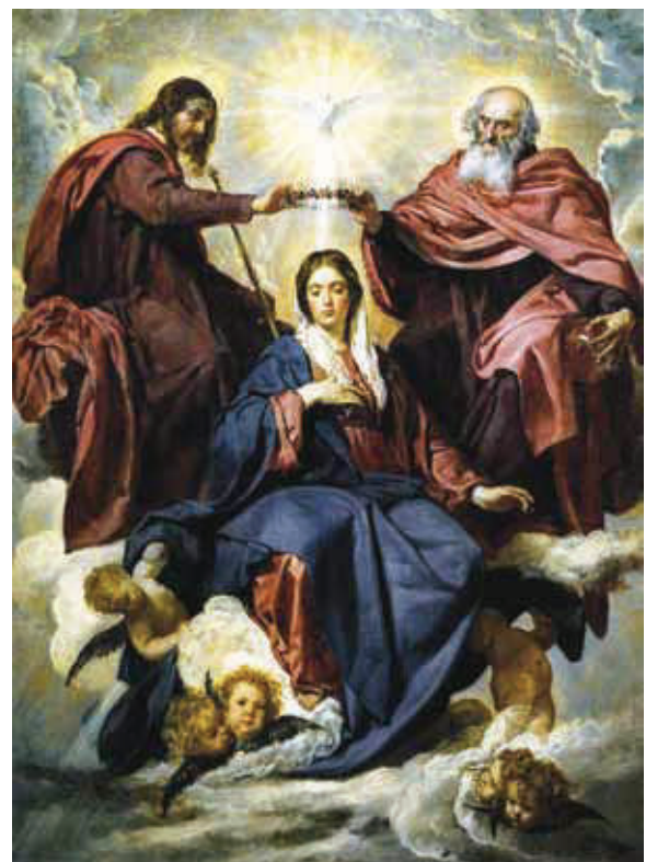
Diego Velázquez, Incoronazione della Vergine con la Trinità, 1641-1644, Museo del Prado, Madrid