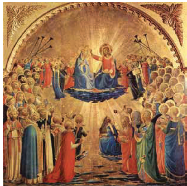
Beato Angelico, Incoronazione della Vergine (particolare) 1434-1435, Galleria degli Uffizi, Firenze

to dell'Incoronazione della tanto venerata statua della "Madonna di Santa Maria". «L'Incoronazione è il riconoscimento più alto alla madre del Signo- re». Così affermò Papa Pio XII nel 1954 quando, quattro anni dopo aver istituito la solennità dell'Assunzione, stabilì con la lettera enciclica Ad caeli reginam , la fe-