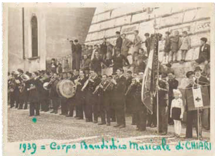
1939 = Corpo Bandistico Musicale di CHIARI

Vorrei averti qui sul mio cuore per sussurrarti frasi d’amor, dirti ch’io t’amo o mio tesor, e viver uniti col nostro amor.