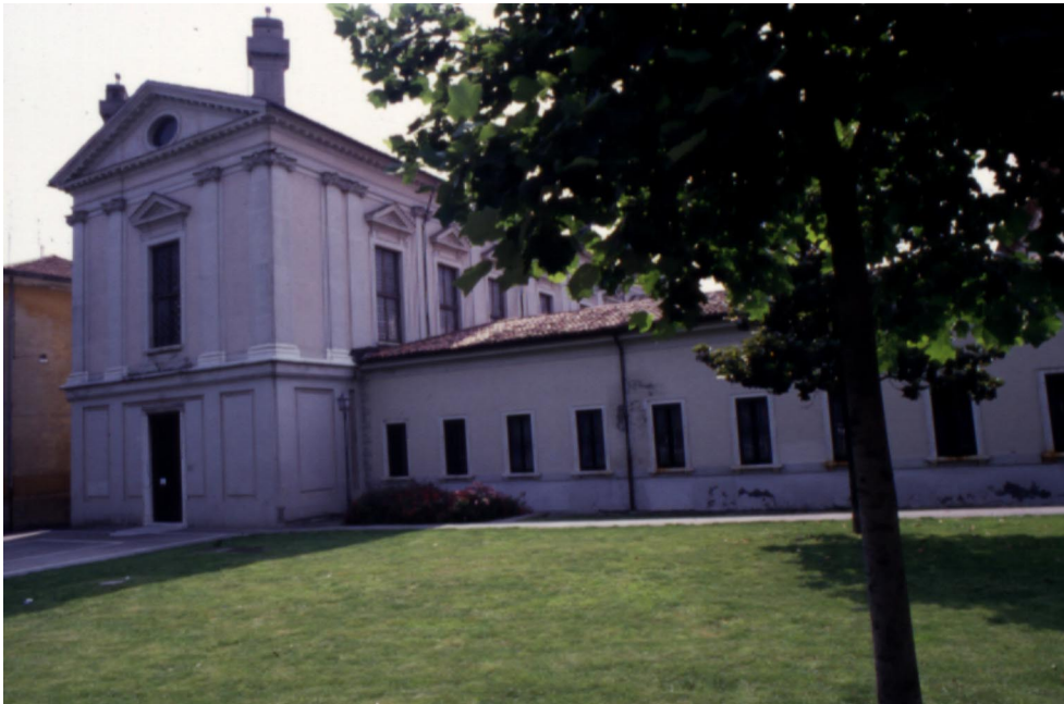
Facciata dell'ex infermeria dell'Ospedale Mellini