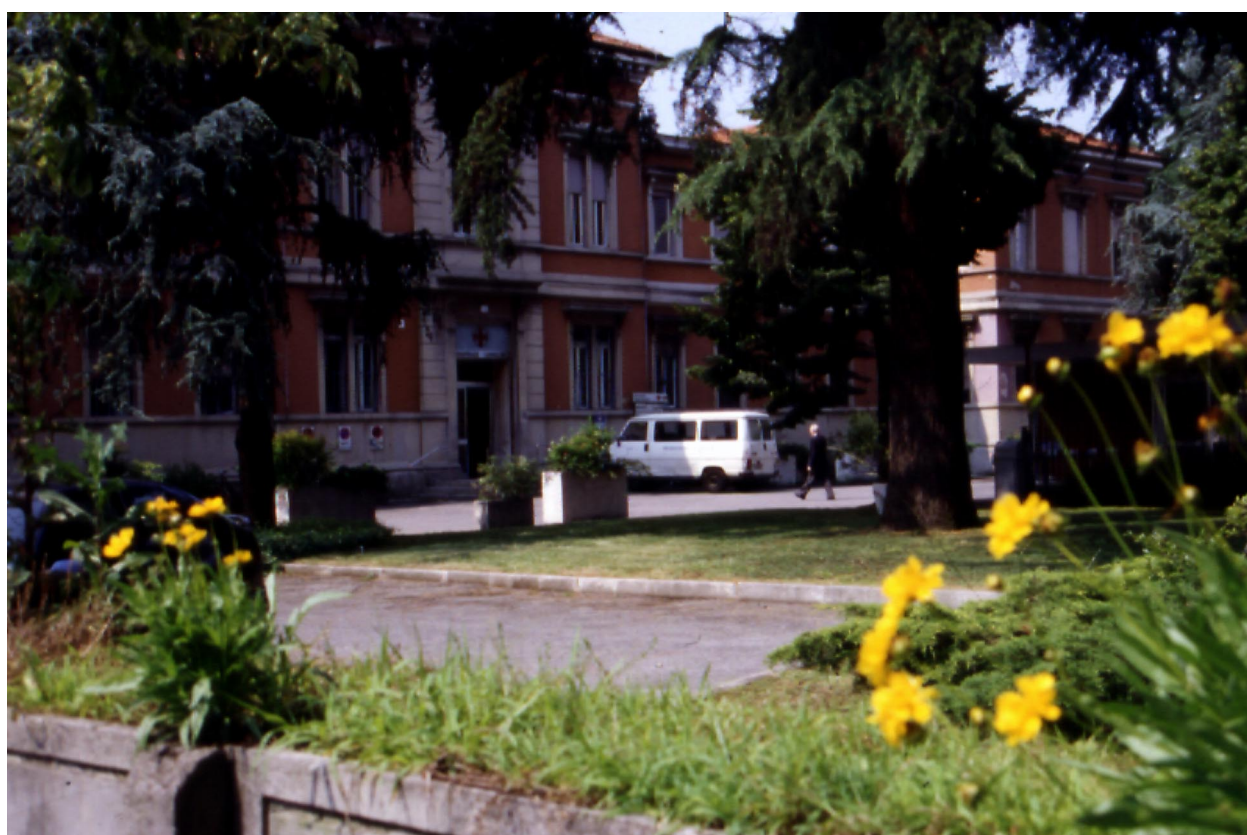
Ingresso dell'Ospedale Mellini, estate 1995