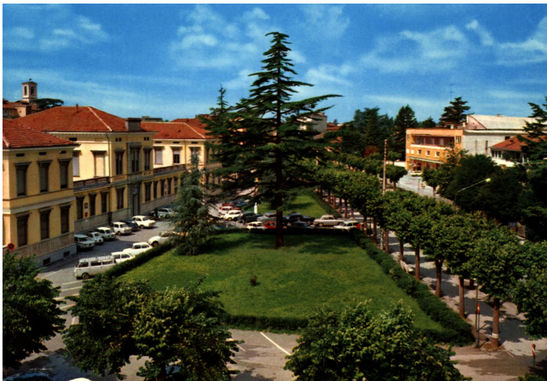
Veduta del nuovo Ospedale, anni '60