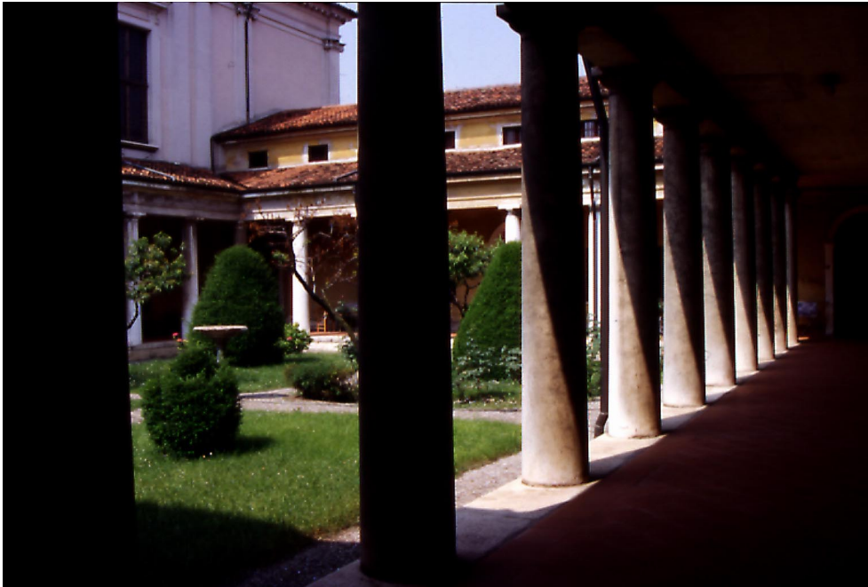
Porticato del vecchio Ospedale Mellini (Chiostro Donegani)