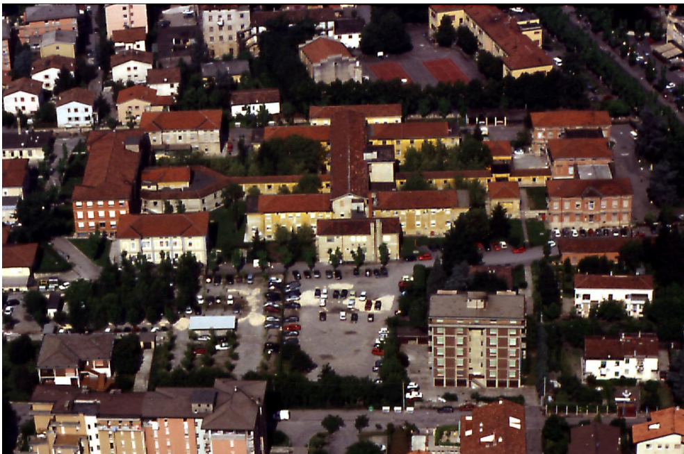
Veduta aerea dell'Ospedale Mellini, estate 1995