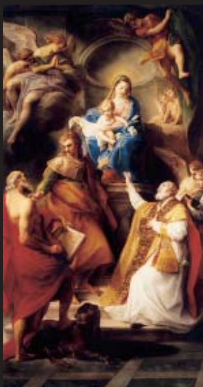
◀ Pala dell'Altare di San Giacomo, Pompeo Batoni, 1780