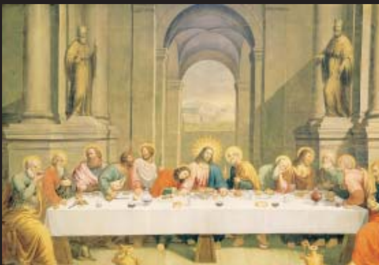
◀ Cappella del Santissimo, Ultima Cena , Autore ignoto, 1665