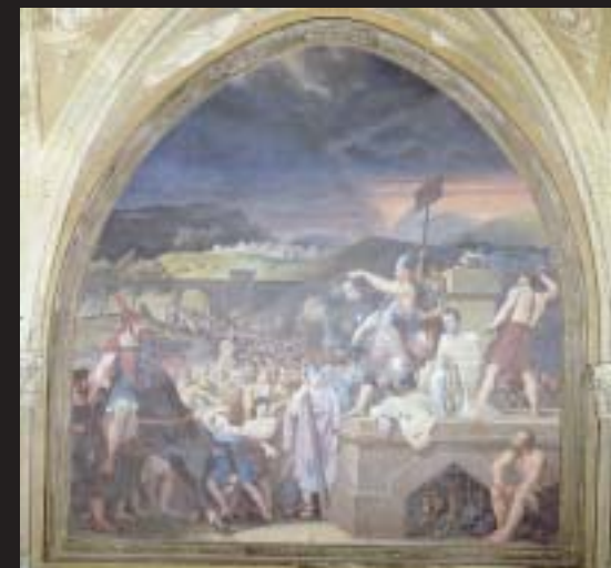
▲ Controfacciata, Martirio dei Santi Faustino e Giovita , Carlo Bellosio e Giuseppe Sogni, 1850