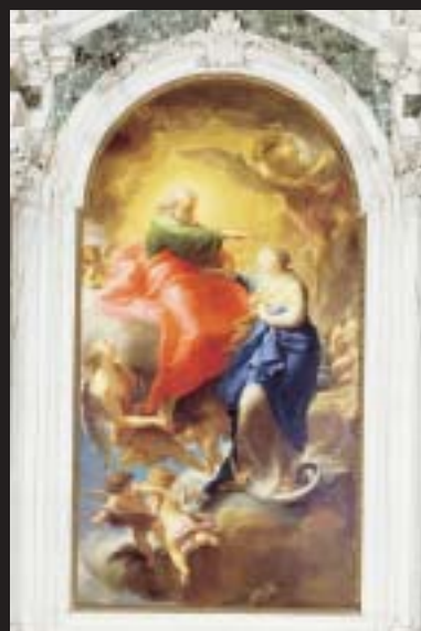
◀ Altare dell'Immacolata, Pompeo Batoni, 1750