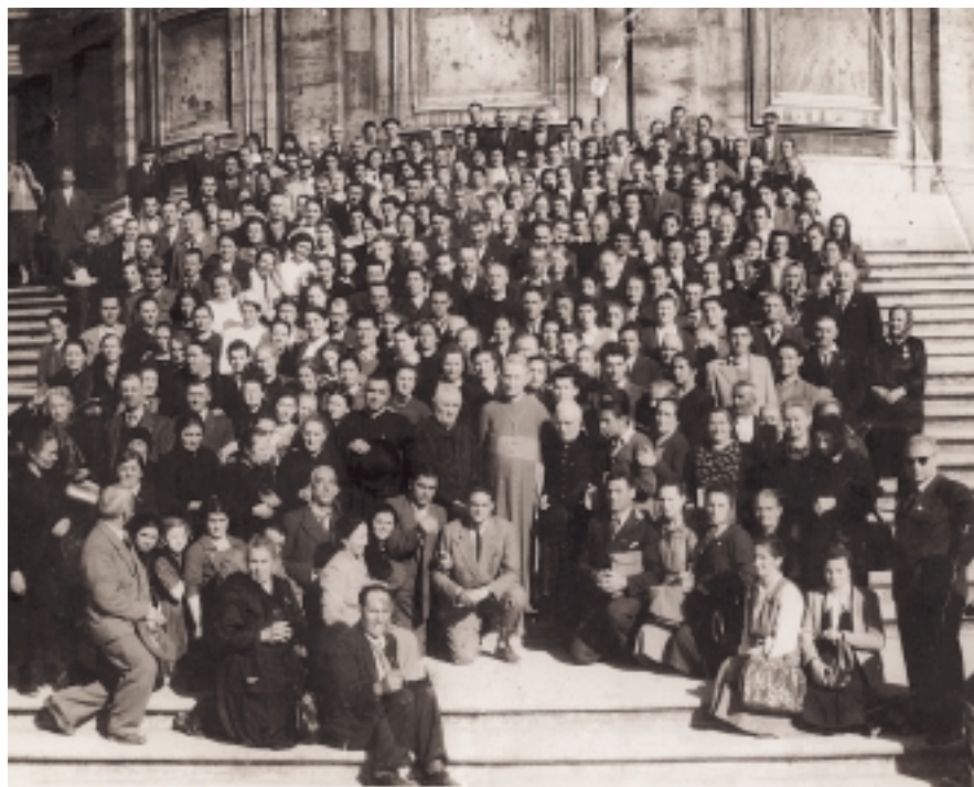
Pellegrinaggio diocesano a Roma per il Giubileo del 1950. Riconoscibili alcuni clarensi.

Pensione completa. Al mattino: deserto di Giuda, Gerico, Qumram, Mar Morto. Rientro a Gerusalemme. Nel