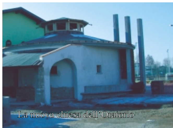
La nuova chiesa dell'Oratorio