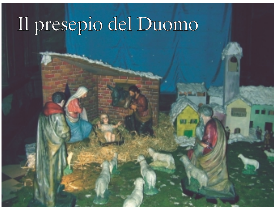
Il presepio del Duomo