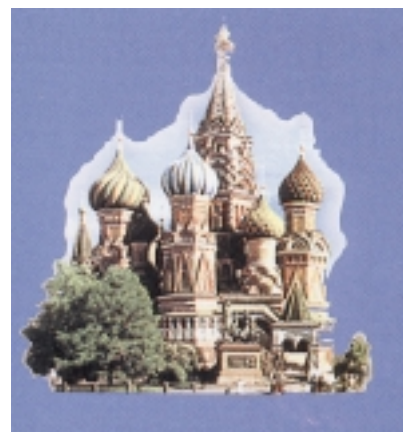
San Salvatore al Sangue di San Pietroburgo, immagine tipica della 'Rus e del mondo orientale.

Da L'Osservatore Romano del 13-14 dicembre 1999