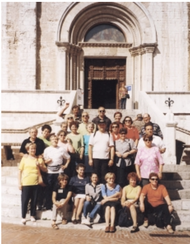
La foto documenta un momento del viaggio di un gruppo di Claresi in Umbria, di cui hanno respirato la mistica atmosfera, e dove hanno pregato, in spirito di fraterna solidarietà, tutti i suoi grandi santi.