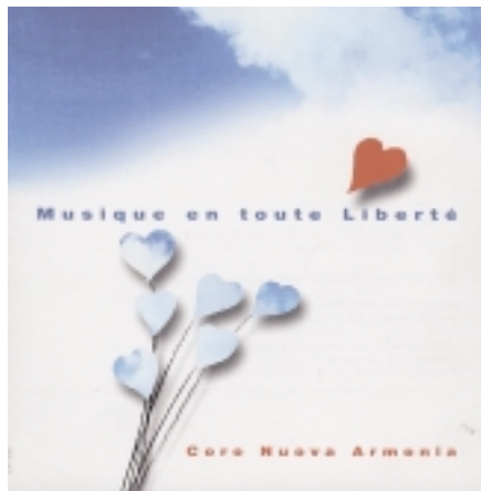
La copertina del CD del Coro "Nuova Armonia".

Se questo è stato l'evento più importante per il coro Nuova Armonia, non dobbiamo dimenticare il Piccolo Coro, che si è presentato con una nuova serie di canti il 12 dicembre 1999 nella Chiesa di San Bernardino nel tradizionale Concerto di Natale. Du-