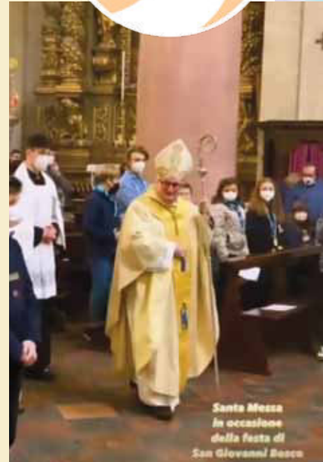
Santa Messa in occasione della festa di San Giovanni Bosco

Il giorno seguente domenica 30 gennaio si è celebrata la messa per San Giovanni Bosco nel Duomo di Chiari, presieduta da Monsignor Enrico dal Covolo, il quale, durante l'omelia ha voluto soffermarsi sulla figura di San Giovanni Bosco, in particolare modo sull'attenzione che quest'ultimo aveva nei confronti dei ragazzi più emarginati.