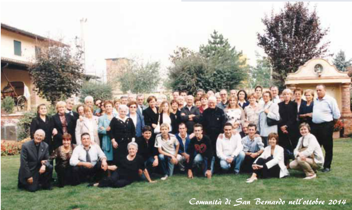
Comunità di San Bernardo nell'ottobre 2014