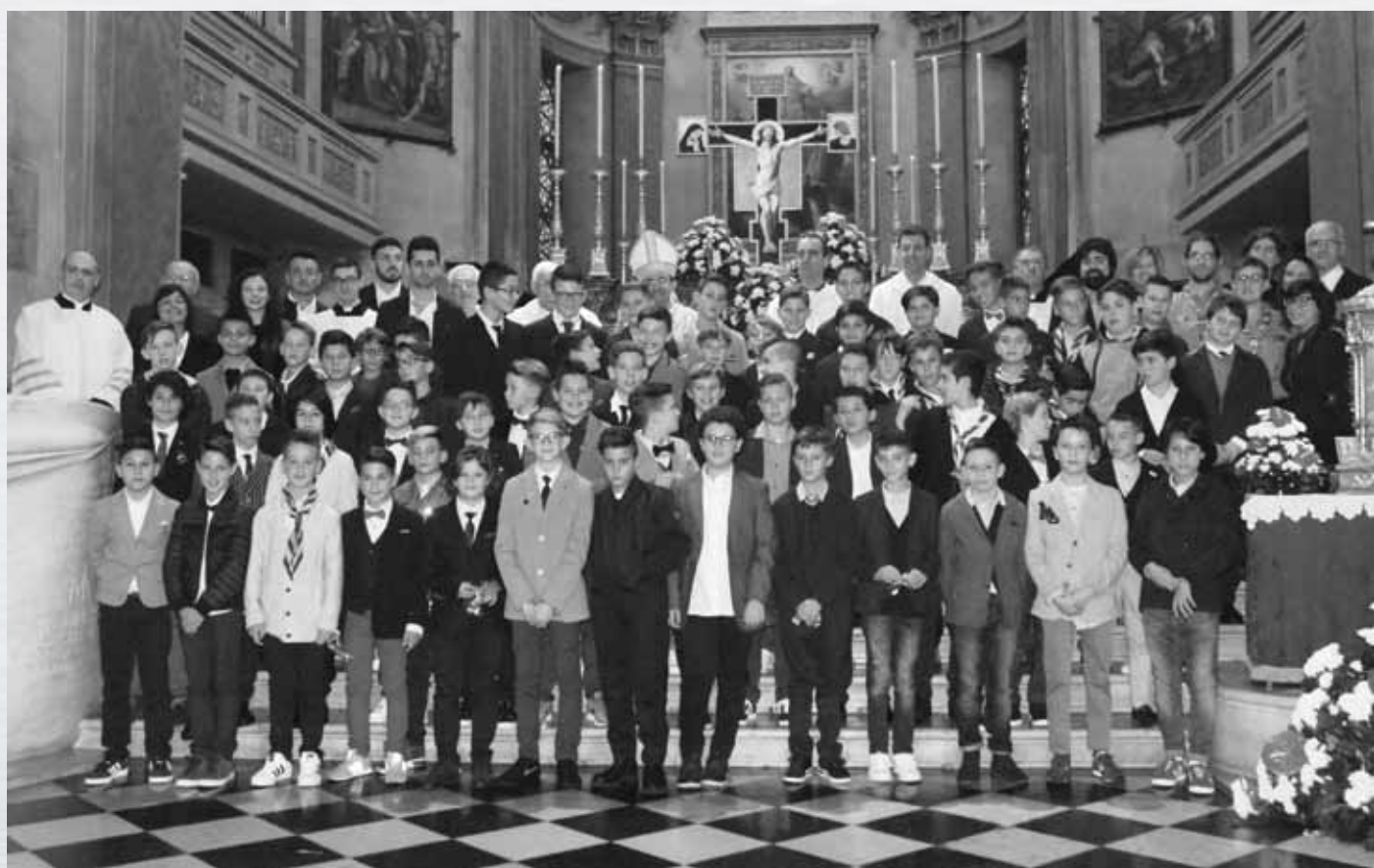
Cresime - Prime Comunioni 22 ottobre 2017 celebrate da Sua Ecc.za Rev.ma Mons. Marco Busca (Vescovo di Mantova)