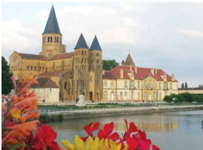
Basilica del Sacro Cuore a Paray-le-Monial

ore 17.00 Esposizione del Santissimo, Vespri, Dottrina e Benedizione Eucaristica in Duomo □