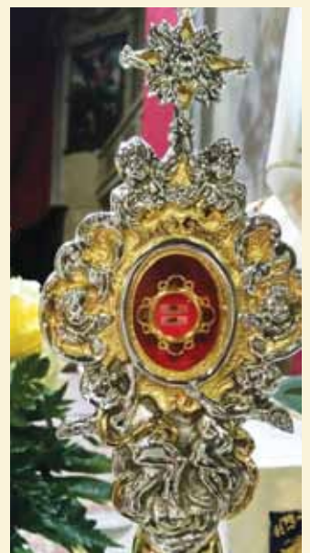
Reliquie dei Santi Francesco e Giacinta

Il passo successivo nel processo di beatificazione di Francesco e di Giacinta avvenne 10 anni dopo, il 28 giugno del 1999, quando Papa Giovanni Paolo II promulgherà il decreto sul miracolo della cura di Emilia Santos, ottenuto per intercessione dei due pastorelli, aprendo il cammino alla beatificazione, la cui celebrazione avvenne, a Fatima, l'anno successivo, il 13 maggio. Il decreto pontificio concesse che i venerabili Francesco e Giacinta potessero esser considerati beati, con festa liturgica il 20 febbraio. Il 13 maggio 2017, durante una solenne celebrazione nel santuario di Fatima, per il primo centenario della prima apparizioni, papa Francesco li ha dichiarati Santi. □