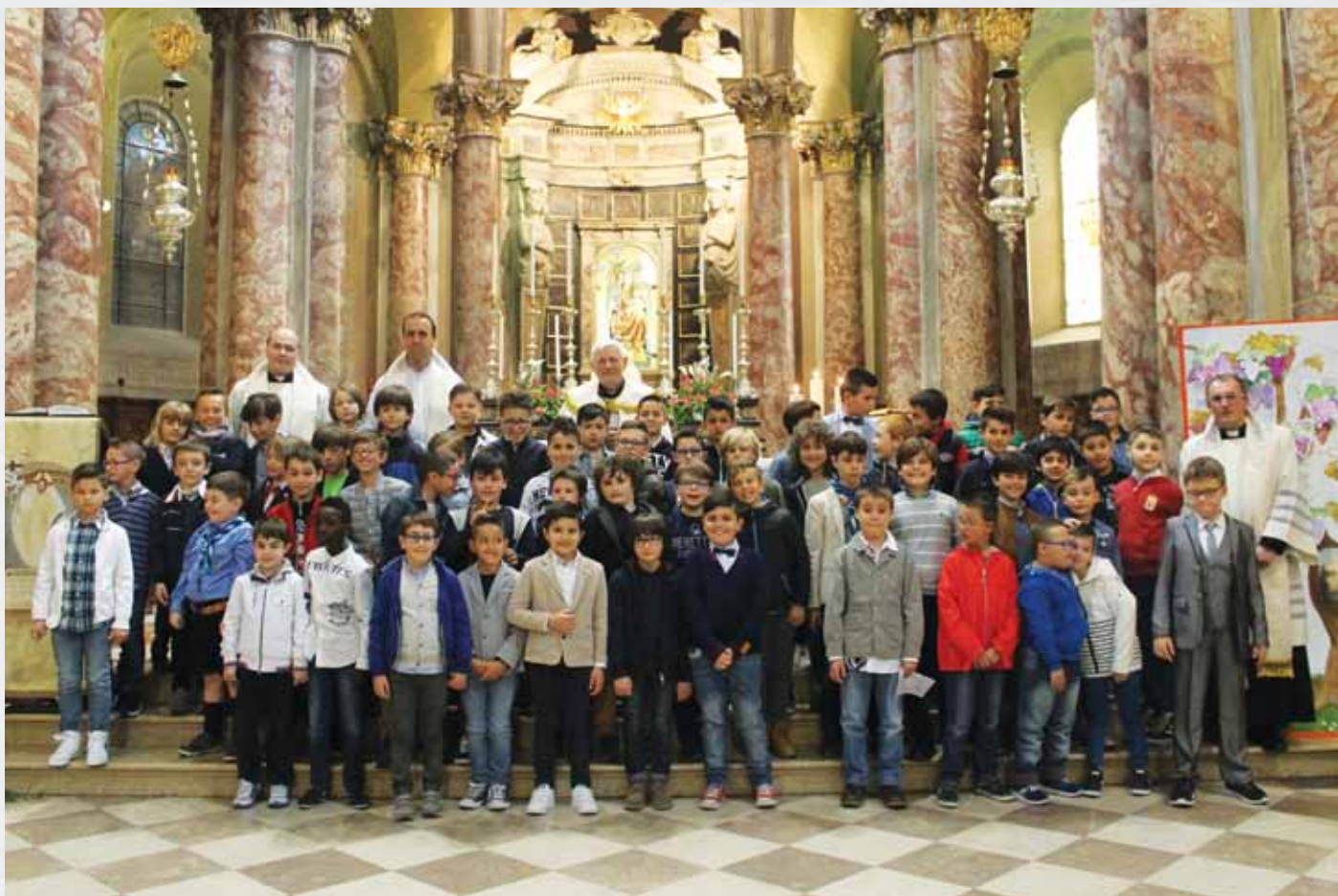
Prime Confessioni - 23 aprile 2017