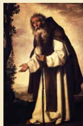
FRANCISCO DE ZURBARÁN, SANT'ANTONIO ABATE, POST 1640, FIRENZE, GALLERIA DEGLI UFFIZI