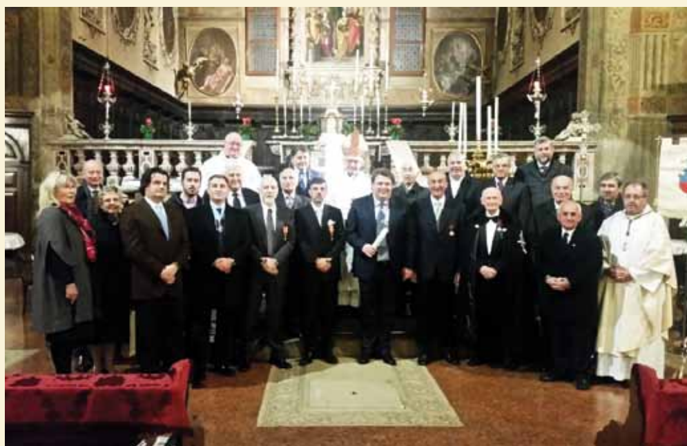
CERIMONIA ONORIFICENZE DEL 14 NOVEMBRE 2015 CHIESA SANT'AGATA IN BRESCIA