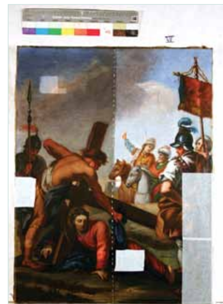
DURANTE L'INTERVENTO DI PULITURA E CONSOLIDAMENTO