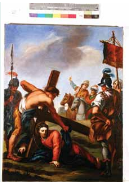
DOPO IL RESTAURO

Il Gruppo di Preghiera degli Amici di San Rocco organizza un pellegrinaggio a Roma, in occasione del