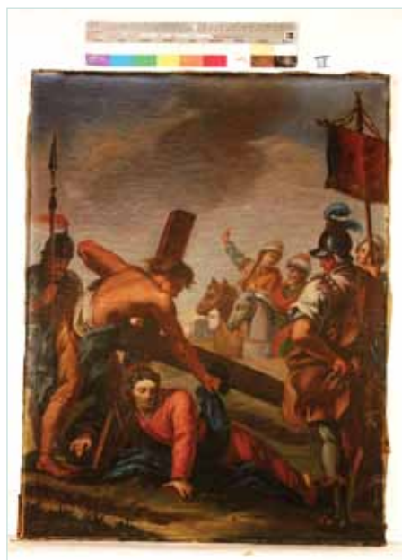
PRIMA DEL RESTAURO