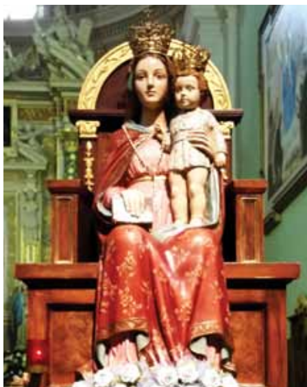
STATUA DELLA MADONNA DELLA BOZZOLA