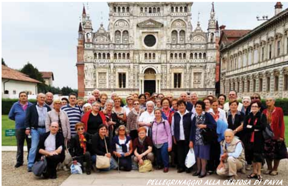
PELEGRINAGGIO ALLA CERTOSA DI PAVIA