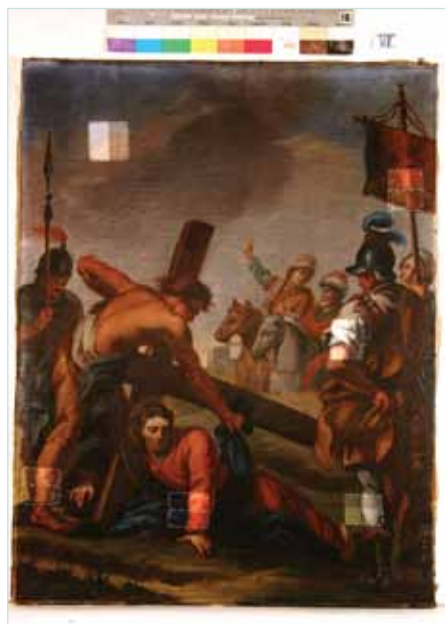
CON I TASSELLI DI PULITURA