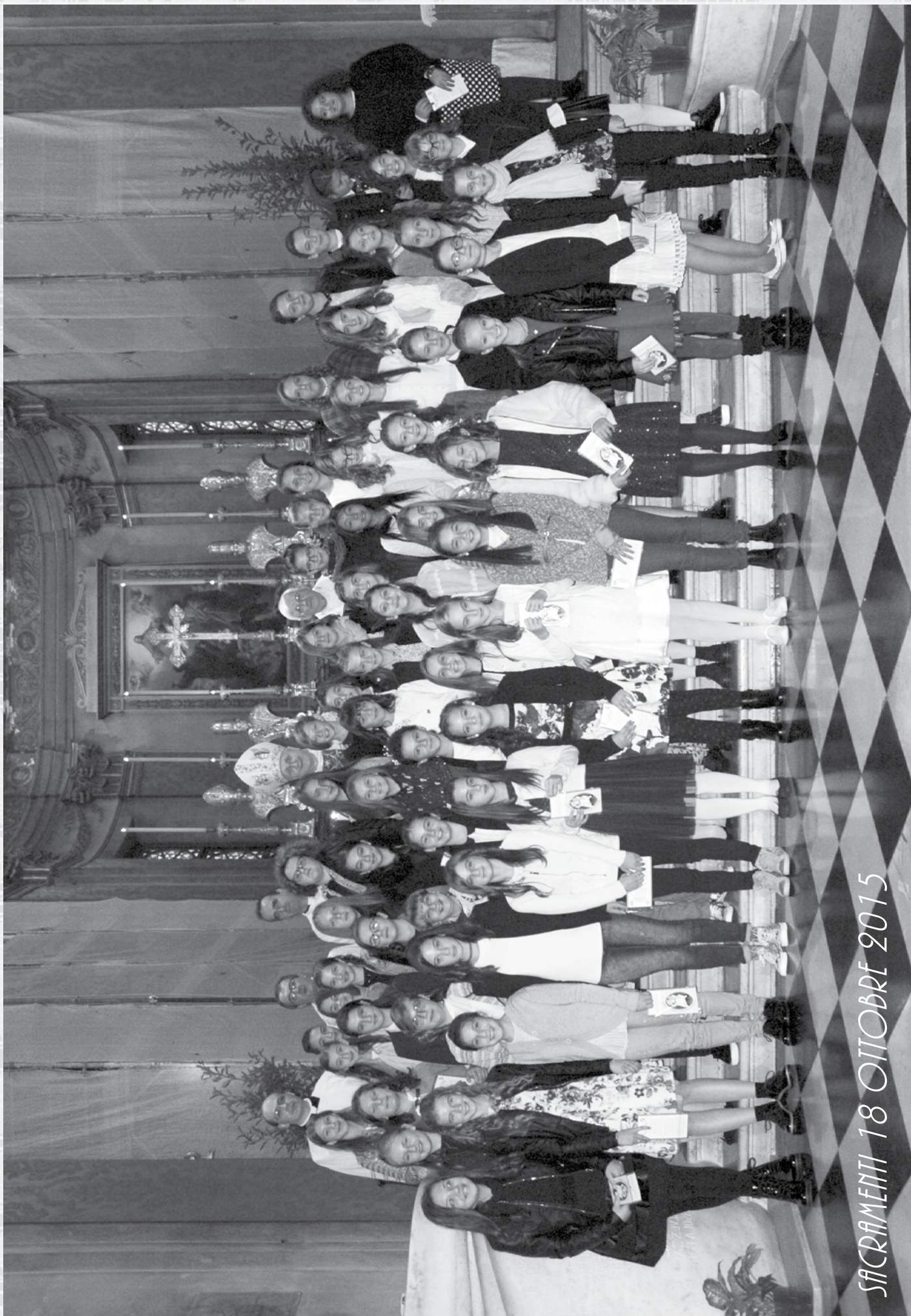
SACRAMENTI 18 OTTOBRE 2015