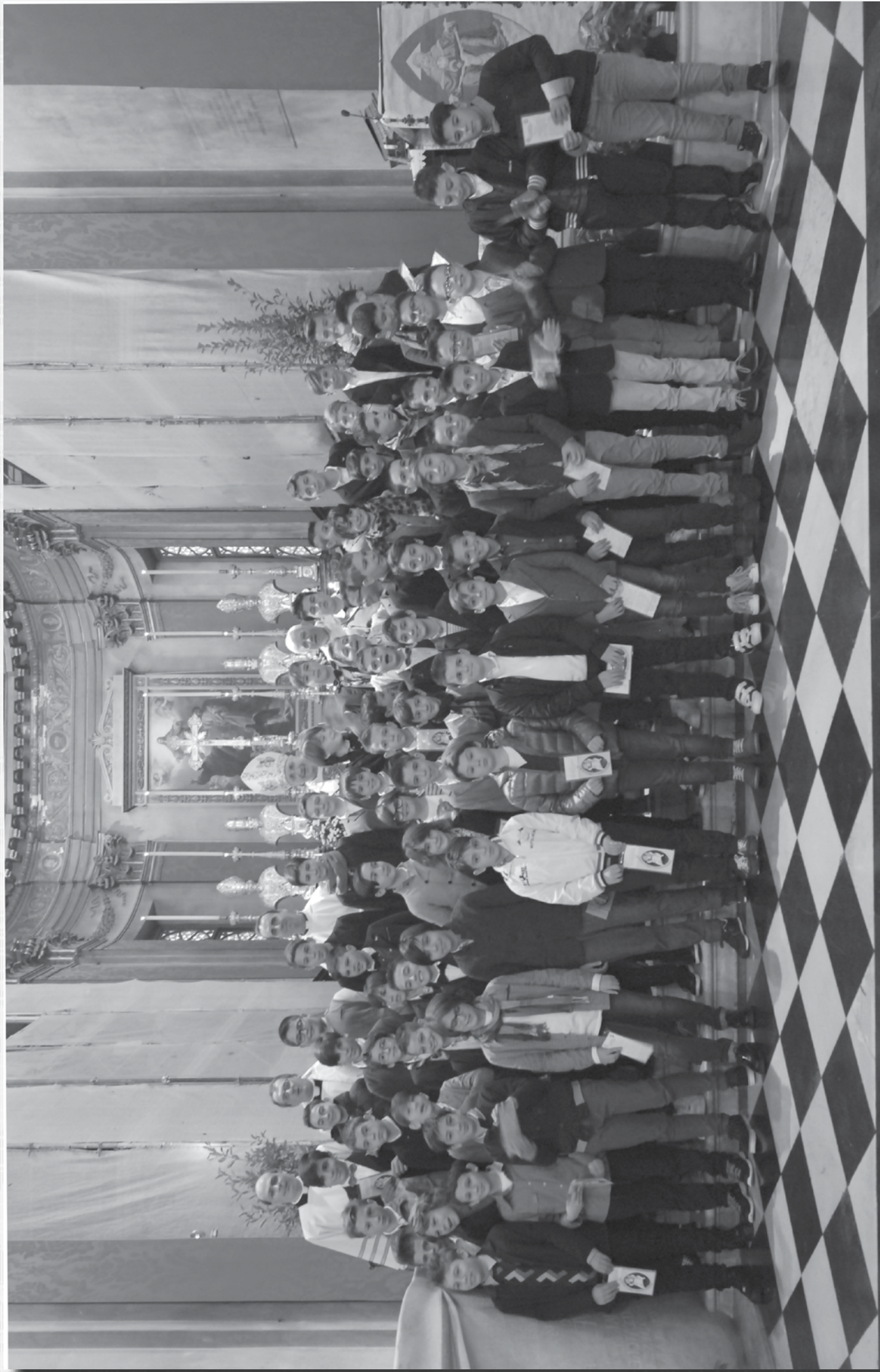
SACRAMENTI 18 OTTOBRE 2015