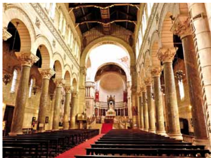
Basilica di San Martino - Tours

Incontro illustrativo lunedì 24 febbraio 2014 , ore 20.45, al Centro Giovanile 2000, Via Tagliata, 2. □