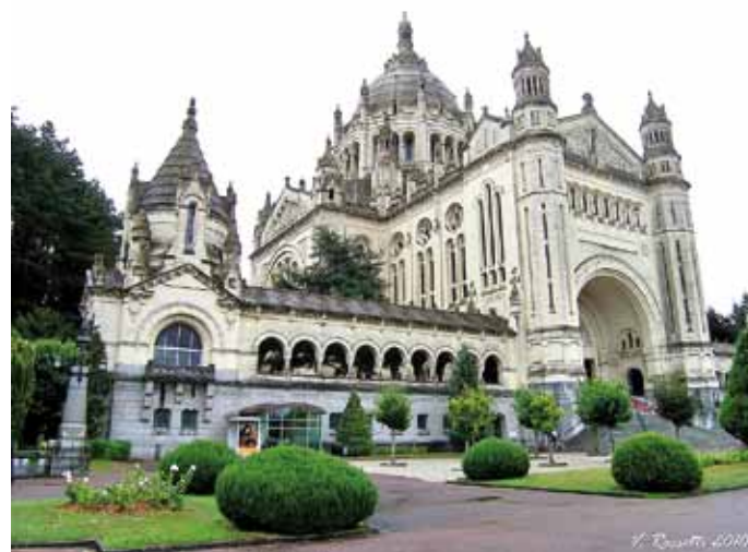
Santuario di Santa Teresa - Lisieux