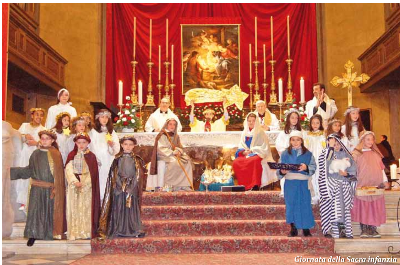
Giornata della Sacra infanzia