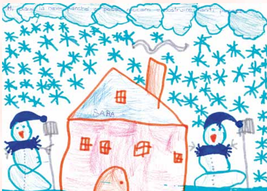
"Fiocchi di neve" di Sara (5 anni) "Mi piace la neve perché ci posso giocare e costruire tanti pupazzi."