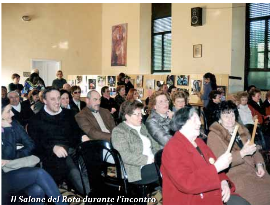
Il Salone del Rota durante l'incontro

Vorresti correre e prenderli in braccio tutti quei poveri bambini!