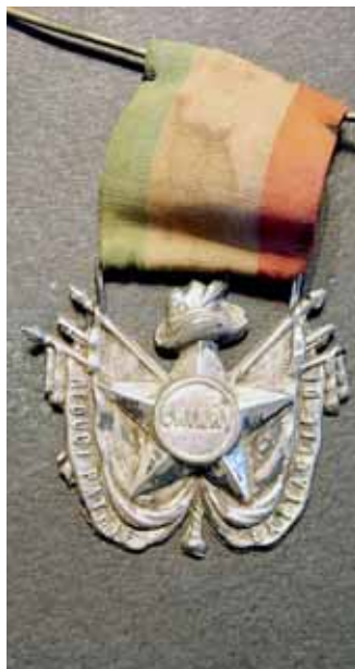
Decorazione dei reduci delle patrie battaglie di Chiari