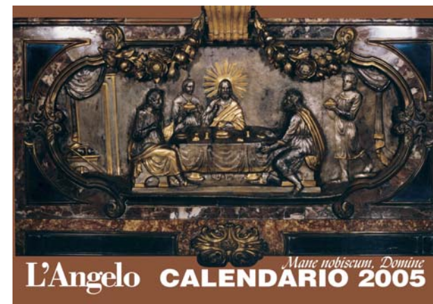
Chiesa parrocchiale dei Santi Faustino e Giovita Cappella del Santissimo Sacramento. Il Signore risorto a mensa con i discepoli di Emmaus e due inservienti.

Post giubilare è la Lettera Apostolica Novo millennio ineunte , dove emerge con forza l'invito a contemplare il volto di Cristo: « Nel secolo XX, specie dal Concilio in poi, molto è cresciuta la comunità cristiana nel modo di celebrare i Sacramenti e soprattutto l'Eucaristia. Occorre insistere in questa direzione, dando particolar rilievo all'Eucaristia domenicale e alla stessa Domenica, sentita come giorno speciale