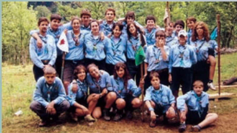
I ragazzi del reparto a Noasca (Torino)