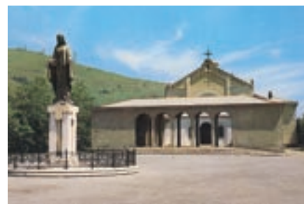
Santuario dell'Immacolata - Genova