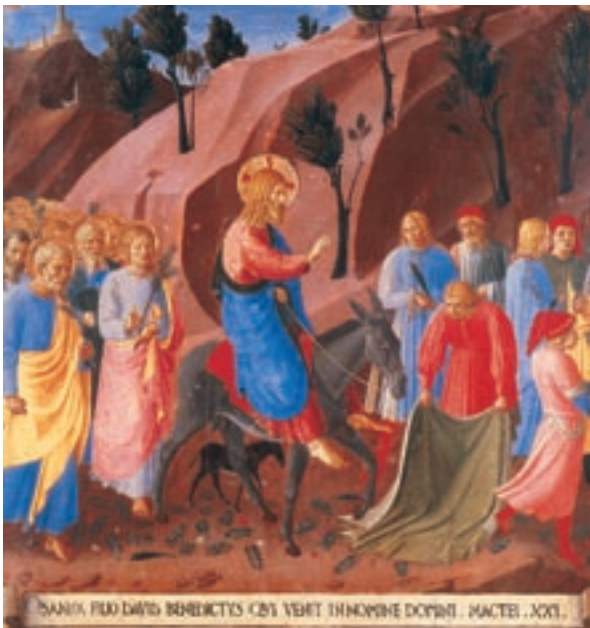
BEATO ANGELICO (1400 ca. - 1455), L'ingresso a Gerusalemme , Firenze, Museo di San Marco

Ora che i suoi genitori sono tornati in cielo e che i fratelli e le sorelle hanno messo su famiglia, don Santino comincia a sentire il peso degli anni. Guarda il suo passato, vorrebbe aver fatto di più, si sente un servo inutile e come tale si presenta al Padre mostrando le sue mani apparentemente vuote. Don Santino è sepolto... nella mente di ognuno di noi, che vogliamo preti come lui: bravi, buoni e belli. Peccato, però, che don Santino di cognome faccia "Inesistente". □