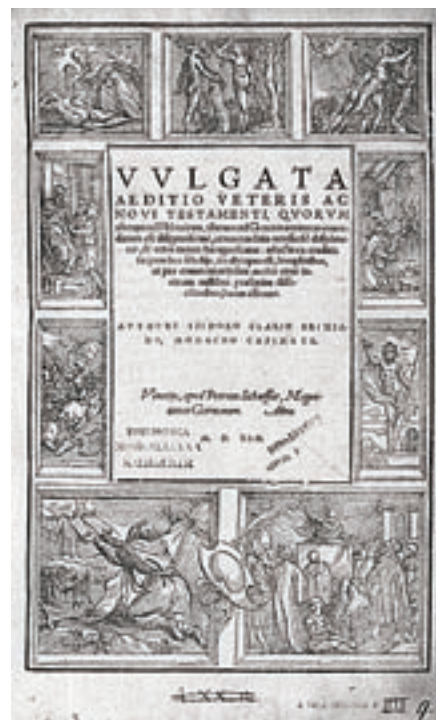
Frontespizio dell'edizione della Bibbia curata da Isidoro Clario.

A Chiari Isidoro ebbe un'istruzione di buon livello nella scuola di lettere latine e greche allora fiorente, dove