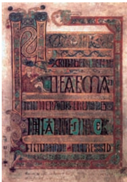
Il libro di Kells, inizio del Vangelo di Matteo, Vangelo di Luca, Genealogia di Cristo; Irlanda, anno 800 circa.

Non ci si sente mai sufficientemente preparati e non sempre abbiamo a disposizione tutto il necessario per un cammino da fare. Siamo convinti allora della necessità di una formazione continua, proprio perché ritenuto uno degli snodi cruciali per avviare e per accompagnare un cambiamento pastorale. La formazione si pone quindi tra l'esperienza del passato e le esigenze del futuro. Ecco allora l'invito "a cavare dal pozzo interiore" una spiritualità forte e decisa che parte da Cristo e riporta a Cristo. I mezzi della spiritualità del catechista sono innanzitutto: l'ascolto della Parola di Dio. In questi giorni il papa Benedetto XVI ri-