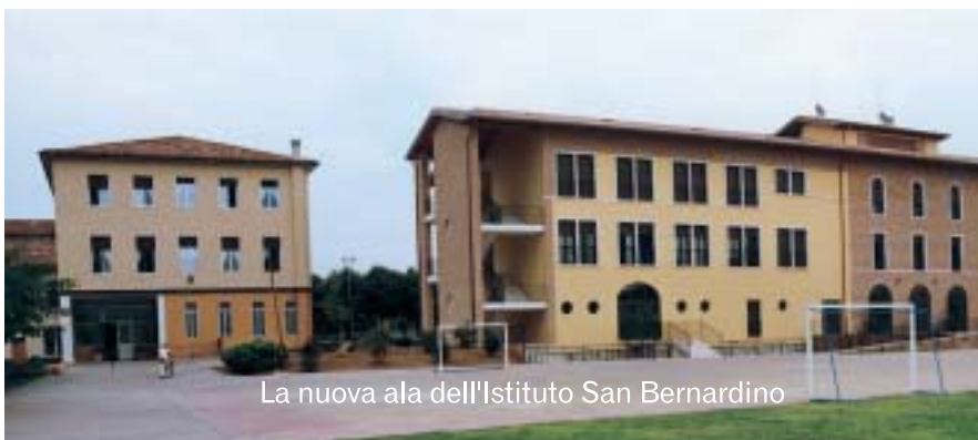
La nuova ala dell'Istituto San Bernardino