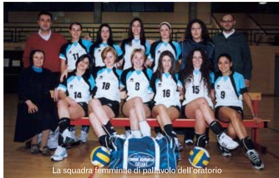
La squadra femminile di pallavolo dell'oratorio