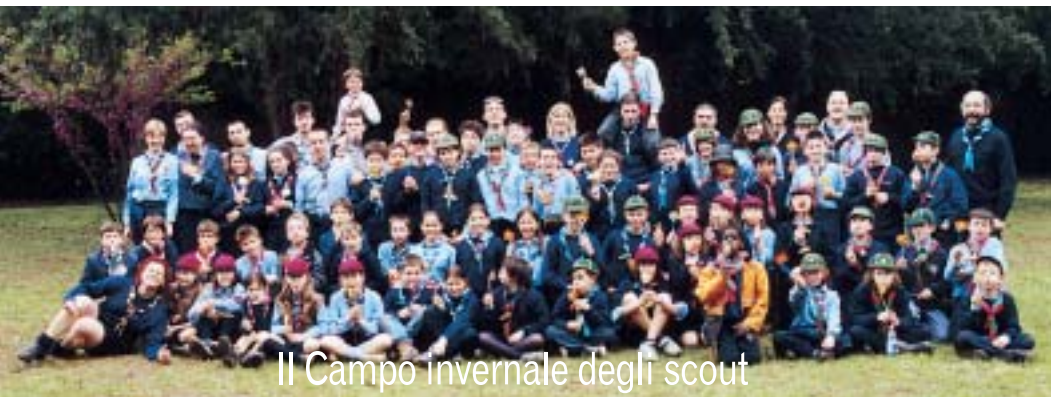
Il Campo invernale degli scout