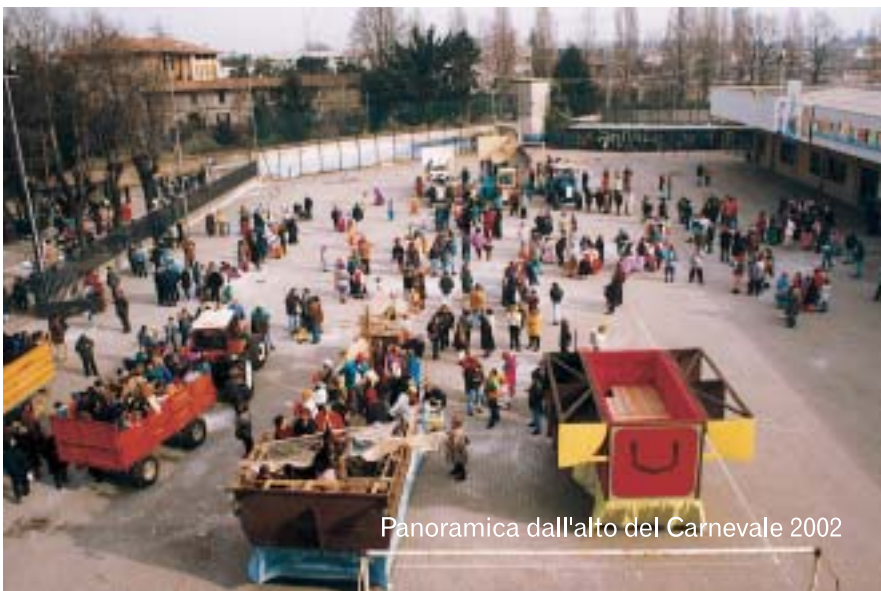
Panoramica dall'alto del Carnevale 2002