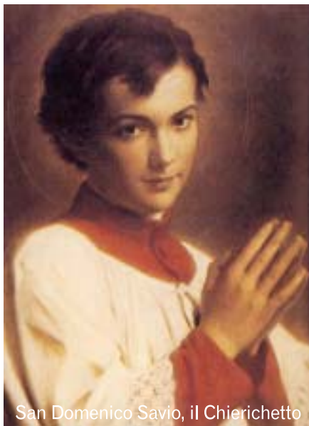
San Domenico Savio, il Chierichetto