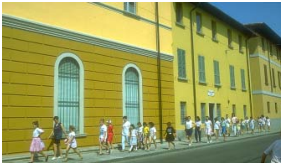
L'ex Oratorio Santa Maria, luogo dove si affronta l'emergenza freddo per tanti fratelli.

L'ospitalità è stata esclusivamente notturna, dalle 19.00 della sera alle 7.30 del mattino; ogni ospite ha usufruito di un posto letto, lenzuola e coperte, doccia calda (obbligatoria giornalmente), salvietta, shampoo e doccia-schiuma, detersivi per lavare a mano i capi d'abbigliamento personali. Al mattino, qualsiasi fosse l'orario di partenza per il lavoro, i volontari preparavano la colazione che, come il pasto serale (portato dagli ospiti) veniva consumata nell'apposita sala. Le lenzuola, le coperte e le salviette sono state lavate all'interno del servizio grazie all'intervento di volontari. La permanenza media degli ospiti è stata di 38 notti, (la massima è stata di 110 notti, mentre la minima è stata di 2 notti). La permanenza poteva essere interrotta dagli ospiti stessi oppure, in caso di mancato rispetto del regolamento, gli ospiti potevano essere allontanati immediata-