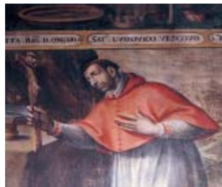
San Carlo Borromeo, particolare. Cappella dei Martiri francescani. Chiesa di San Bernardino.

«satis ampla et decenter ornata». È interessante notare che negli stessi anni veniva realizzato nel duomo cittadino un altare dedicato al Santo Arcivescovo e che nella pala era raffigurato, al lato destro, San Francesco di Assisi in contemplazione della Vergine. La rimozione dei due quadri ha messo in luce una fase della costruzione della cappella. La differenza degli intonaci fra la parte bassa e quella più alta, la presenza di parte delle travi lasciate nel muro, dopo averle segate a filo, dimostrano come in origine il vano avesse un'altra destinazione e fu sopraelevato per trasformarlo nella prima cappella sul lato destro della chiesa di San Bernardino, quando all'inizio del 1700 si ricostruì la chiesa stessa.