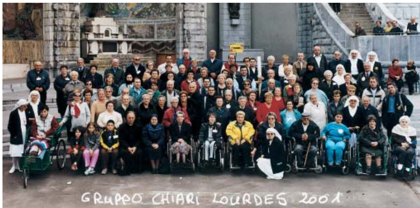
Il gruppo “Unitalsi di Chiari” che ha partecipato al tradizionale pellegrinaggio di ottobre a Lourdes.