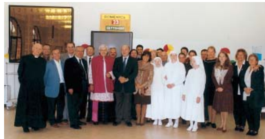
Festa per il nuovo prevosto alla Casa di Riposo Pietro Cadeo con la partecipazione del Sindaco, del Presidente, del Cappellano, delle Suore Ancelle, del Consiglio di amministrazione e degli ospiti.

Le auguro che la sua presenza nella nostra comunità venga apprezzata e amata per la modestia e per l'umiltà che lei ha nel portare avanti la parola evangelica e che la sua opera non passi inosservata o sia data per scontata.