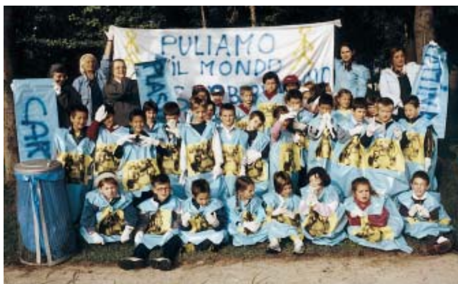
Ecologisti anche i bimbi della prima elementare di San Bernardino. Chiari - 29 settembre 2001