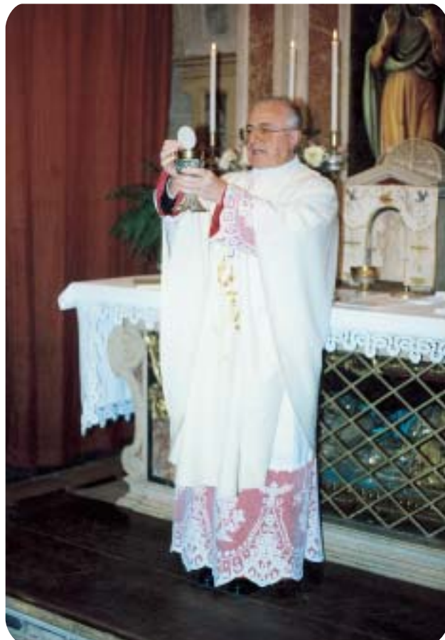
Cripta di Sant'Agape durante la celebrazione di un matrimonio