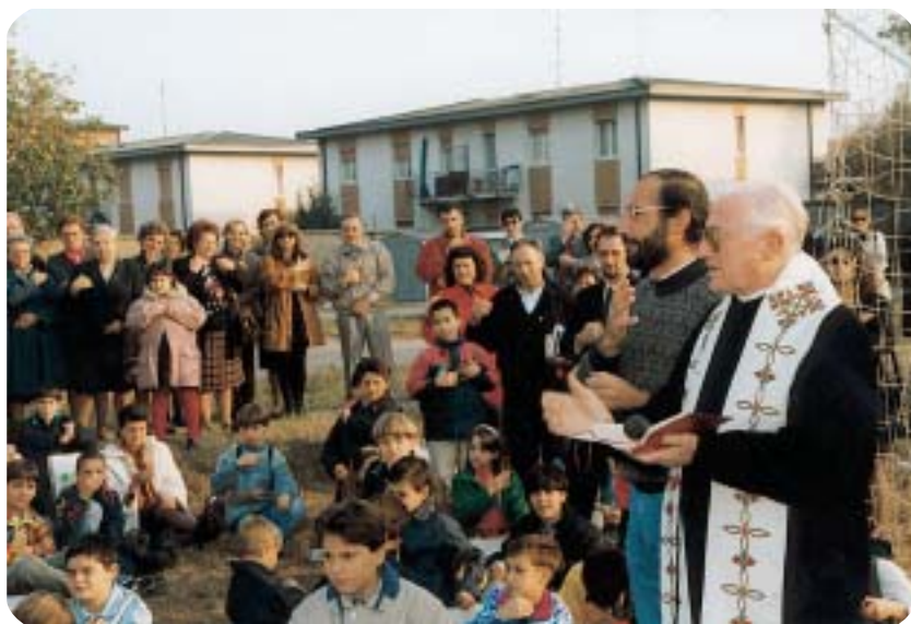
Avvio dei lavori di sistemazione degli impianti sportivi (1997)